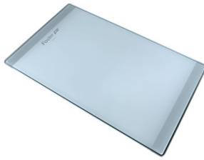
Schneidebrett aus Glas 8631 300