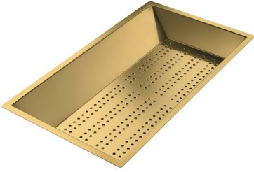
Perforierte Edelstahlwanne PVD Gold