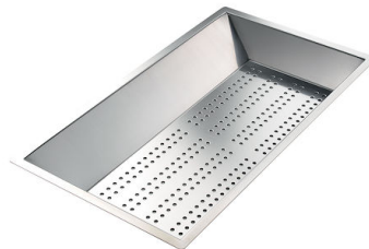
Perforierte Edelstahlwanne 8151 000 * nur in Kombination mit dem Zubehör 8644 101