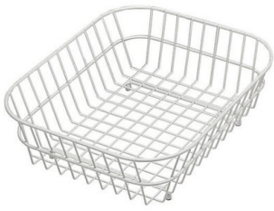
Edelstahlkorb 8612 000