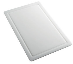
Schneidebrett aus HPDE 8657 001