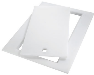
Schneidebrett Twin aus HPDE 8644 101