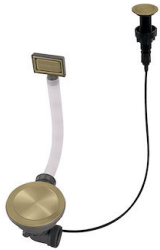
Automatischer Abfluss Space Push Gold