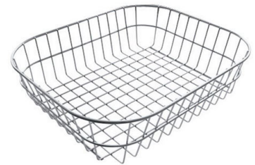
Edelstahlkorb 8611 000