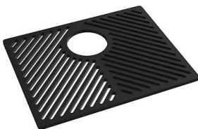
Griglia Black 8100 652